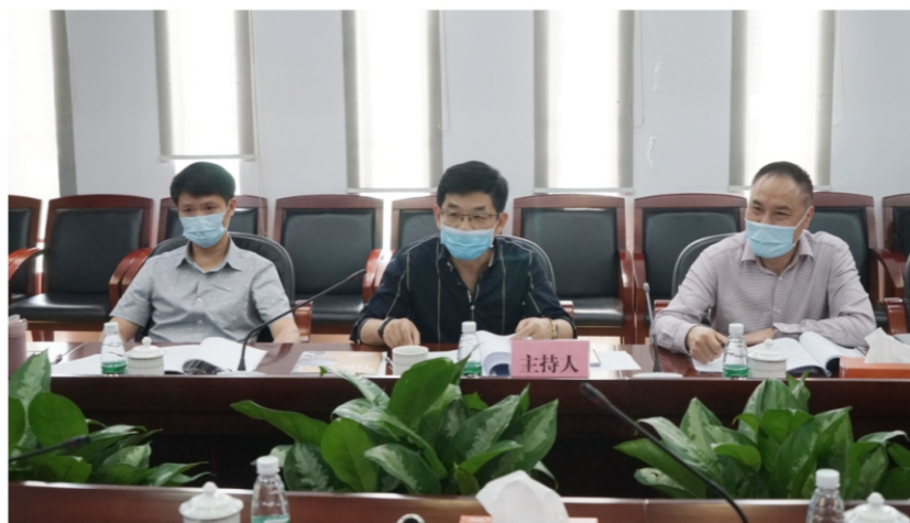
◆文艺中心第三届理事会第二次会议 时间:2020年4月28日 地点:顺德演艺中心附楼1号会议室