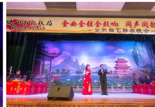
◆ 佛山市私伙局联盟系列活动之顺德区粤剧曲艺展演: 新领域曲艺团金秋曲艺联欢晚会 时间:2020年11月19日 地点:新领域演艺馆