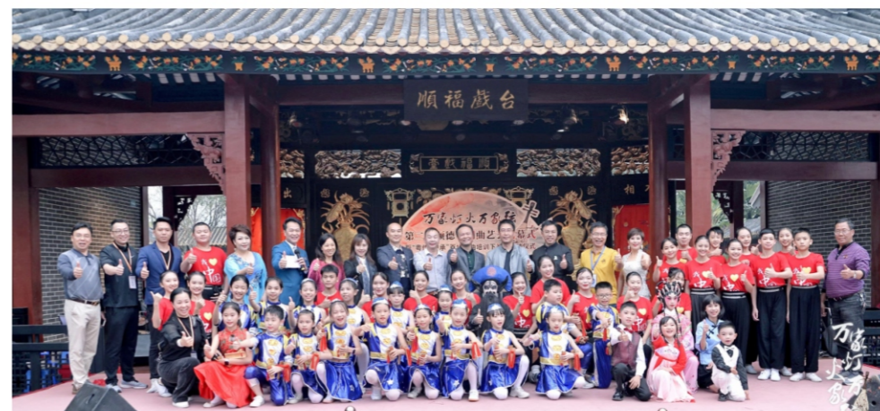
◆ 万家灯火万家弦——第二届顺德粤剧曲艺荟闭幕式:优秀节目暨2020明日之星展演 时间:2020年12月13日 地点:顺峰山公园粤剧大观园