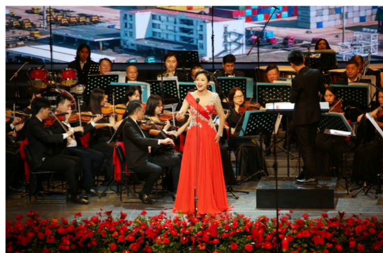
◆ 有一种力量——致敬最可爱的人·八一建军节交响乐音乐会 时间:2020年7月31日 地点:顺德演艺中心音乐厅