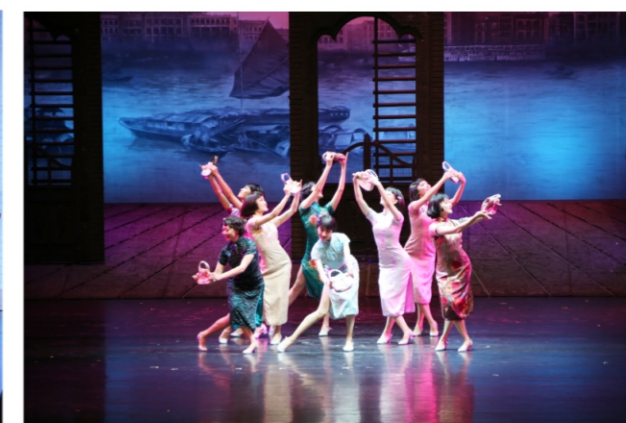
◆ 2020“顺德之夜”文化艺术盛宴:音乐剧《西关小姐》 时间:2020年9月4-5日 地点:顺德演艺中心大剧院