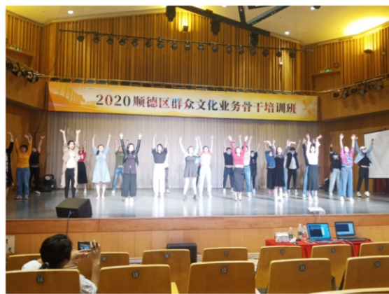
◆ 2020顺德区群众文化业务骨干培训班 2020年10月28日 地点:顺德演艺中心音乐厅