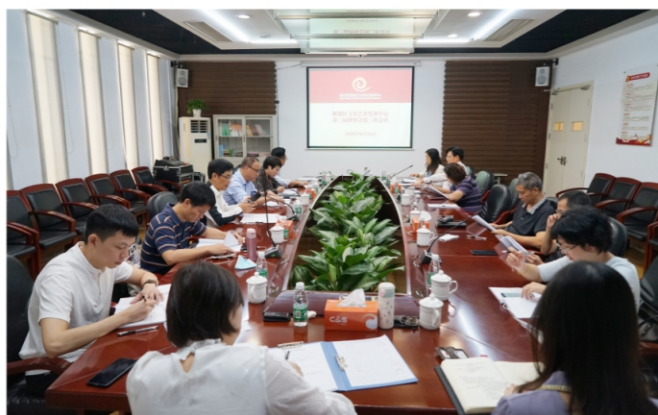
◆ 文艺中心第三届理事会第三次会议