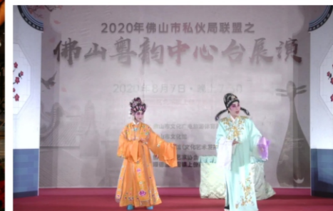
◆ 2020年佛山市私伙局联盟之佛山粤韵中心台展演 时间:2020年8月7日 地点:顺德区北滘镇上寮村