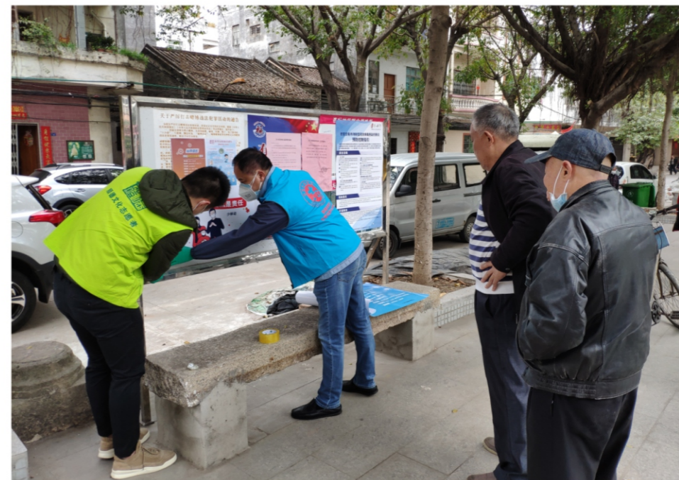
◆文艺中心党支部党员志愿服务队对杏坛镇疫情防控社会宣传查缺补漏 时间:2020年2月2日 地点:陈村镇各村居