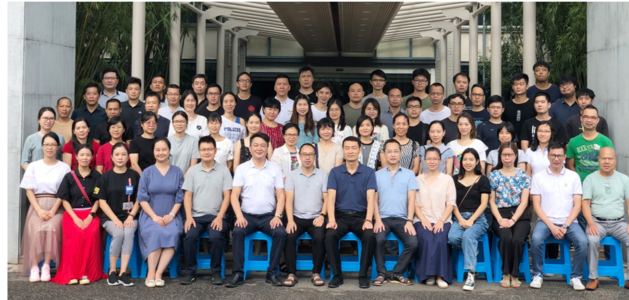
◆ 2020顺德区群众文化业务骨干培训班 时间:2020年9月21-25日 地点:北京师范大学珠海分校