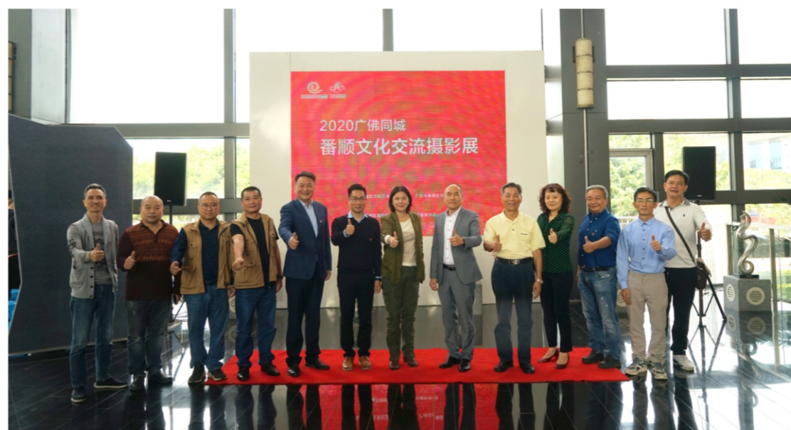
◆ 2020广佛同城番顺文化交流摄影展 时间:2020年10月23日 地点:顺德演艺中心大剧院一楼长廊和二楼艺术展区