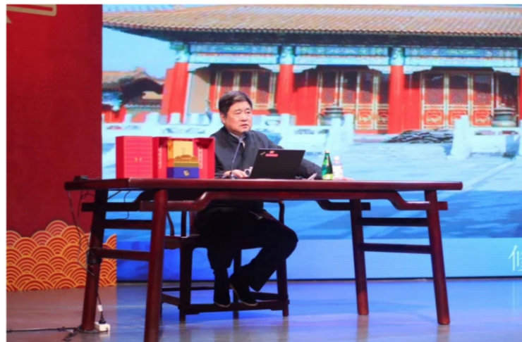
◆紫禁600年——故宫院长震撼开讲 时间:2020年1月14日 地点:顺德演艺中心音乐厅