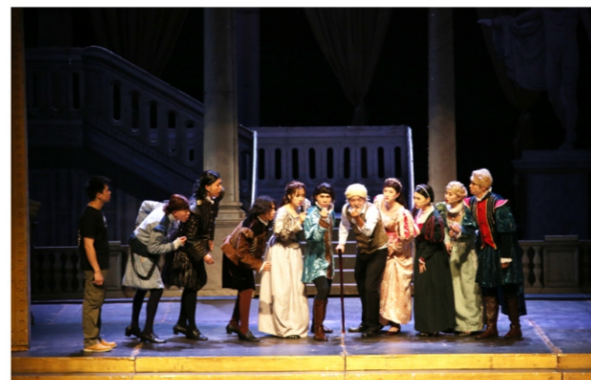
◆ 2020年顺德大剧院精品艺术季: 开心麻花舞台剧《莎士比亚别生气》 时间:2020年10月25日 地点:顺德演艺中心大剧院