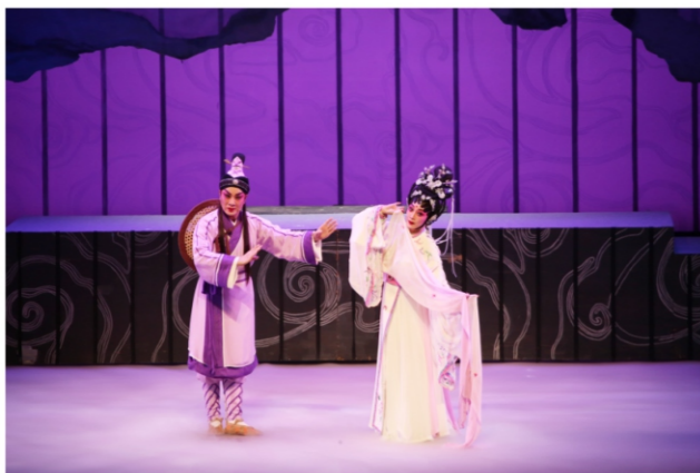
◆ 2020金秋粤剧巡演启动仪式——粤剧《鹊桥会》 时间:2020年10月13日 地点:顺德演艺中心大剧院