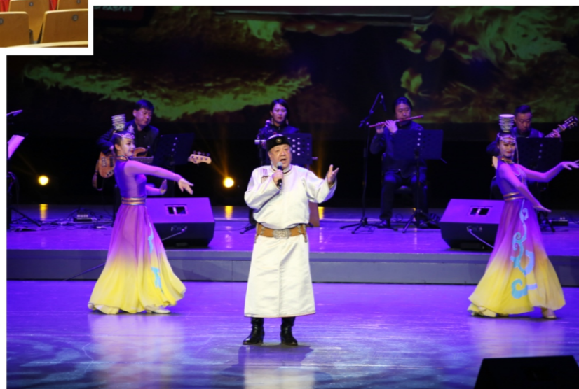
◆ 2020年顺德大剧院精品艺术季: 歌从草原来——内蒙古十大歌唱家 经典名曲音乐会 时间:2020年11月7日 地点:顺德演艺中心大剧院