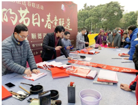
◆ “我们的节日·春意联连”2021顺德迎春送福下基层送春联活动 时间：2020年12月20日 地点：顺峰山公园