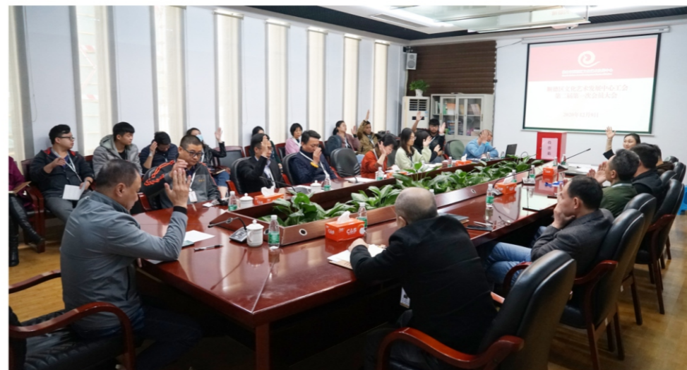
◆ 文艺中心工会换届选举 时间:2020年12月9日 地点:顺德演艺中心附楼1号会议室