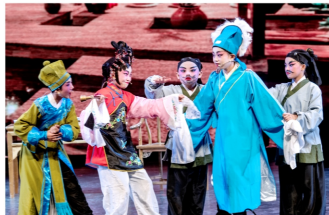
◆ 2020“广佛同城 番顺同欢”曲艺交流活动 时间:2020年10月18日 地点:番禺市桥文化中心