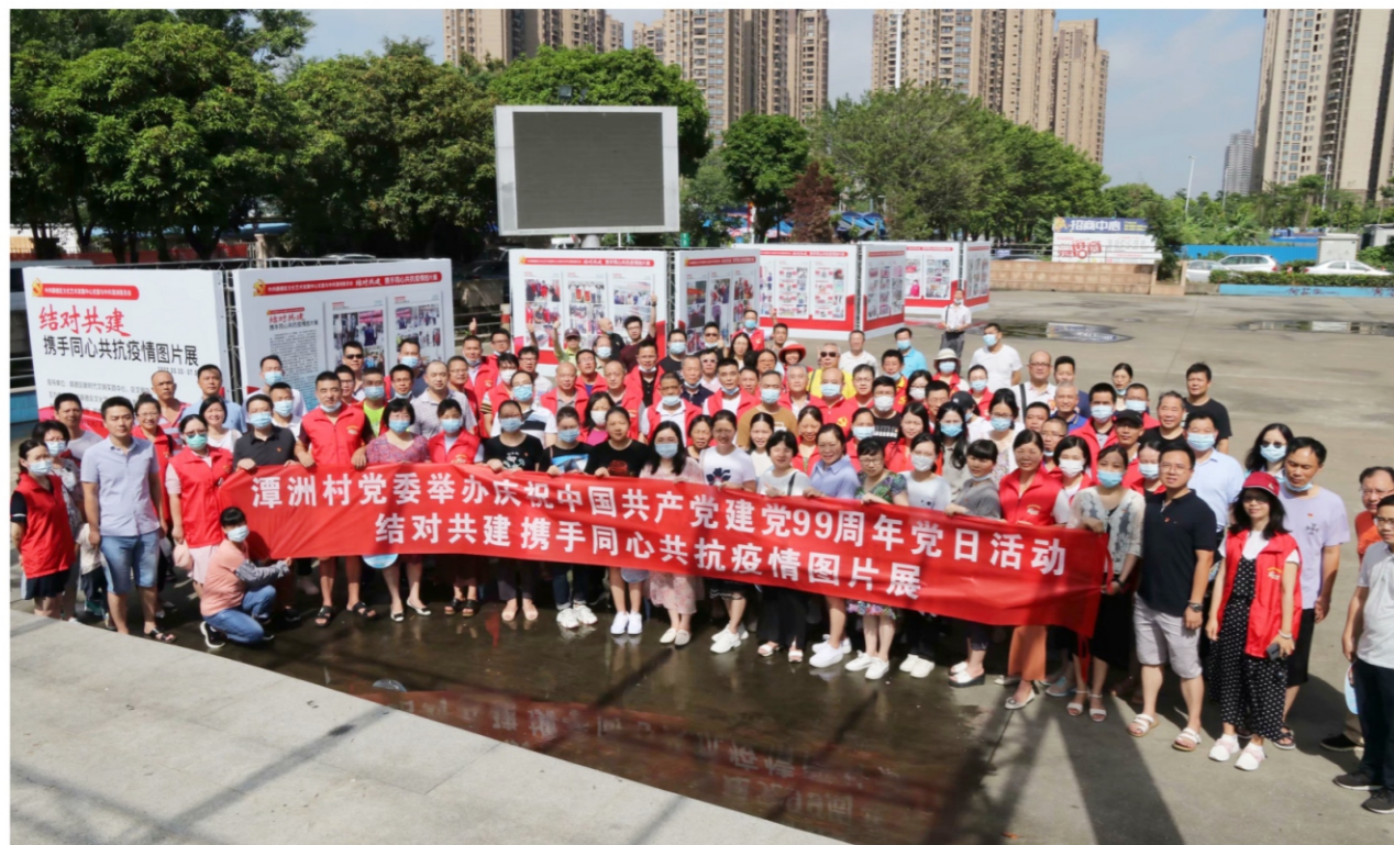
◆ 中共顺德区文化艺术发展中心支部与中共潭洲委员会结对共建 携手同心共抗疫情图片展 时间:2020年6月30日至7月5日 地点:陈村潭洲村文化广场