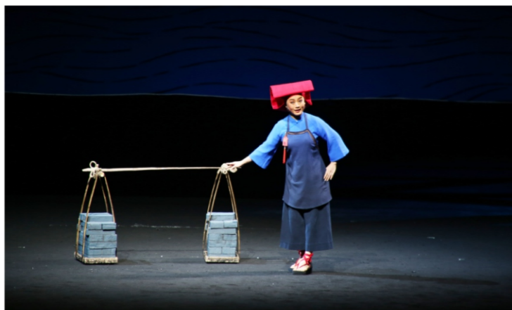
◆ 2020“顺德之夜”文化艺术盛宴： 广东粤剧院——现代粤剧《红头巾》 时间：2020年12月24日 地点：顺德演艺中心大剧院