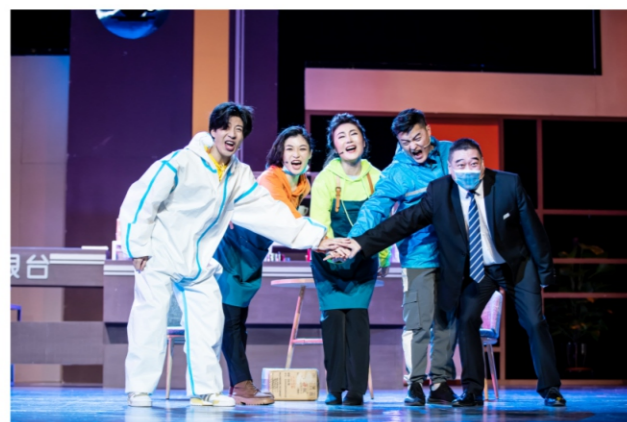
◆ 顺德原创抗疫题材话剧《爱的拿铁》于顺德演艺中心大剧院首演 时间:2020年7月11-12日 地点:顺德演艺中心大剧院