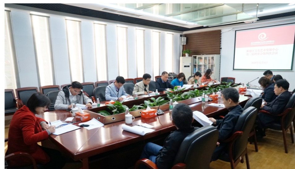
◆ 文艺中心第三届理事会第四次会议