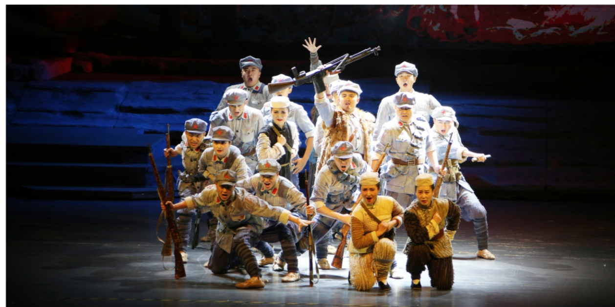
◆ 2020年顺德大剧院精品艺术季:大型原创音乐剧《花儿与号手》 时间:2020年11月23日 地点:顺德演艺中心大剧院