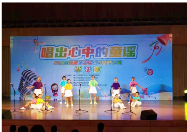
◆ 唱出心中的童谣——2020顺德区第三届少儿歌手大赛半决赛 时间:2020年10月24日 地点:顺德演艺中心音乐厅