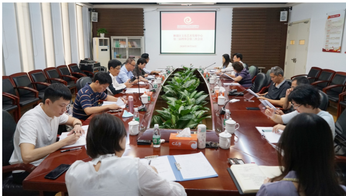
◆ 文艺中心第三届理事会第三次会议 时间:2020年10月16日 地点:顺德演艺中心附楼1号会议室