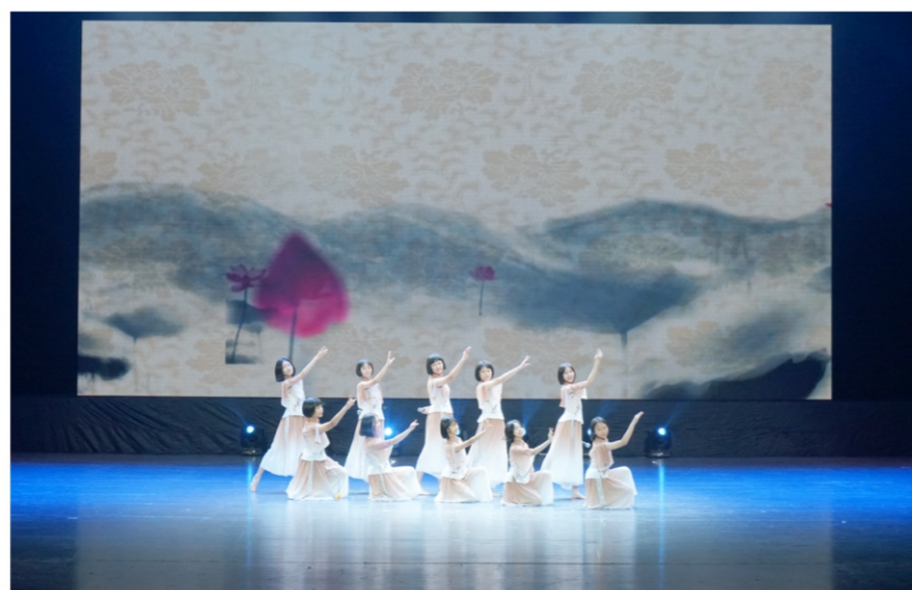
◆ “凤展芳华”顺德高质量发展 音乐原创作品晚会 时间:2020年12月8日 地点:顺德演艺中心大剧院