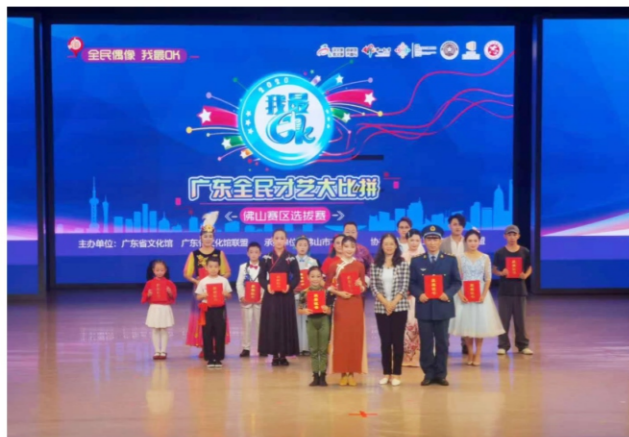
◆ 2020“我最ok”广东全民才艺大比拼佛山赛区选拔赛 时间:2020年10月16日 地点:佛山市青少年宫