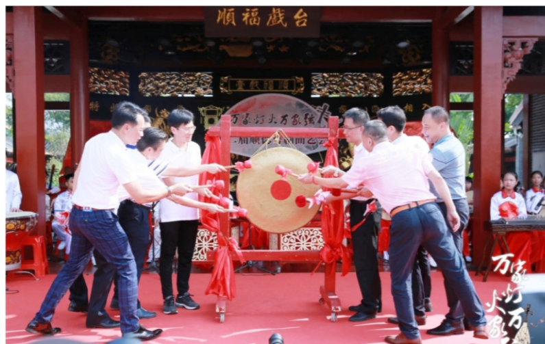
◆ 万家灯火万家弦 ——第二届顺德粤剧曲艺荟启动仪式 时间:2020年9月12日 地点:顺峰山公园粤剧大观园