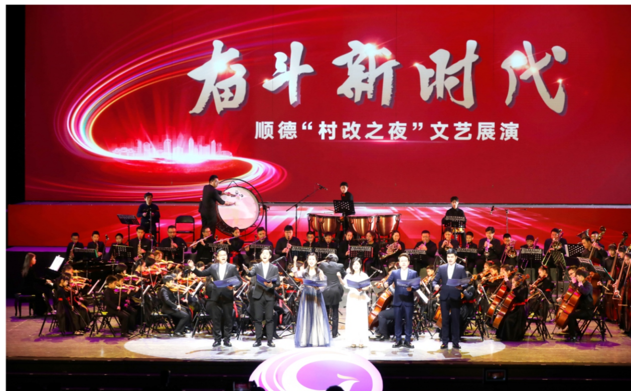
◆ 奋斗新时代——顺德“村改之夜”文艺展演 时间：2020年12月31日 地点：顺德演艺中心大剧院