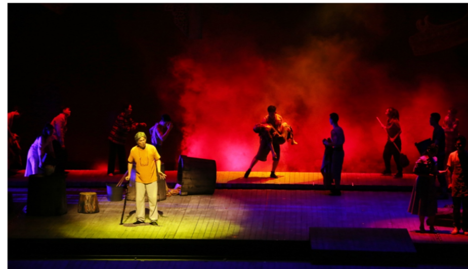
◆ 2020“顺德之夜”文化艺术盛宴: 顺德原创音乐剧《天边的云裳》 时间:2020年11月18日 地点:顺德演艺中心大剧院