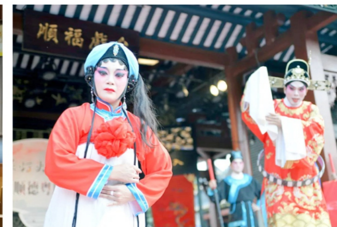
◆ 万家灯火万家弦——第二届顺德粤剧曲艺荟: 佛山市一团粤剧有限公司粤剧折子戏专场 时间:2020年10月10日 地点:顺峰山公园粤剧大观园