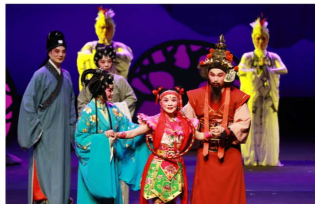
◆ 大型儿童粤剧《大话哪吒》 时间:2020年11月13日 地点:顺德演艺中心大剧院