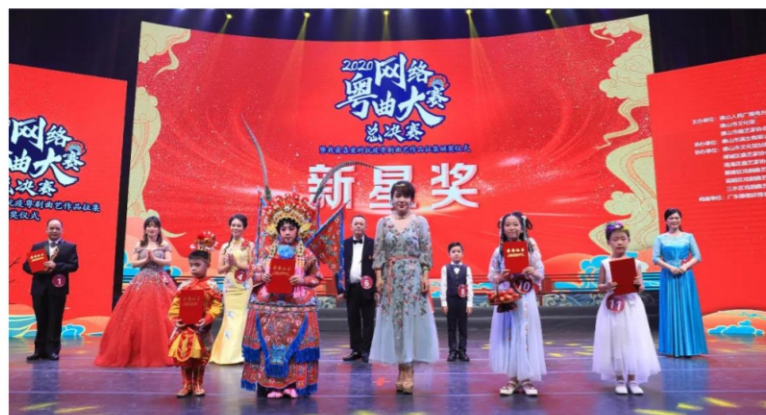
◆ 2020网络粤曲大赛总决赛暨我最喜爱的抗疫粤曲曲艺作品征集颁奖仪式 时间:2020年7月23日 地点:佛山金马剧院