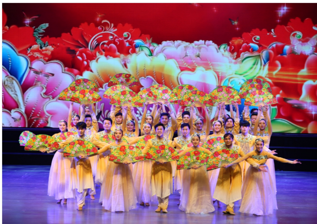
◆南方歌舞团精品荟萃巡演——2020顺德新春音乐会 时间:2020年1月10日 地点:顺德演艺中心大剧院