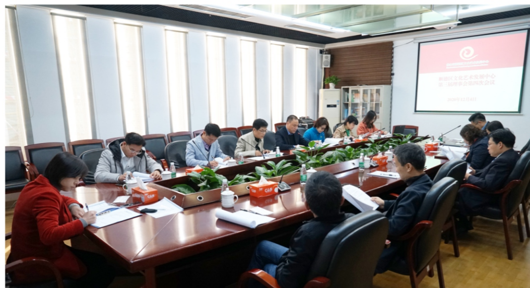
◆ 文艺中心第三届理事会第四次会议 时间:2020年12月4日 地点:顺德演艺中心附楼1号会议室