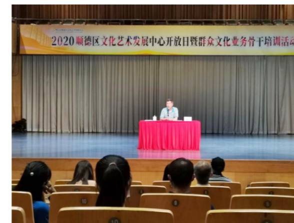
◆ 2020顺德区文化艺术发展中心开放日暨群众文化业务骨干培训活动 时间:2020年9月27日 地点:顺德演艺中心音乐厅