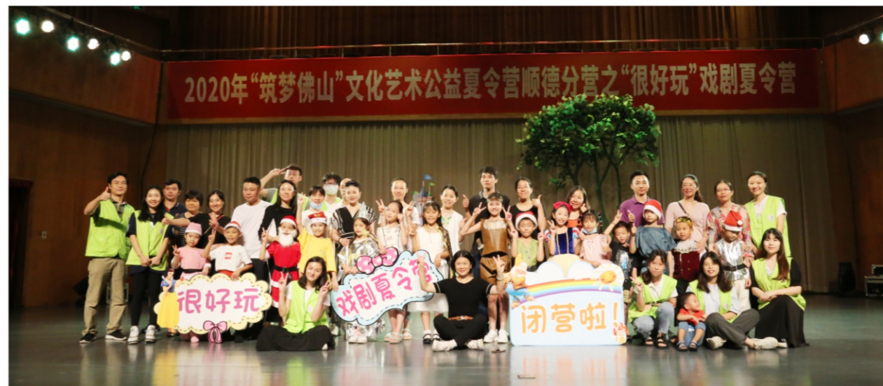
◆ “筑梦佛山”文化艺术公益夏令营顺德分营——“很好玩”创作性教育戏剧工作坊 时间:2020年8月2-6日 地点:顺德演艺中心音乐厅