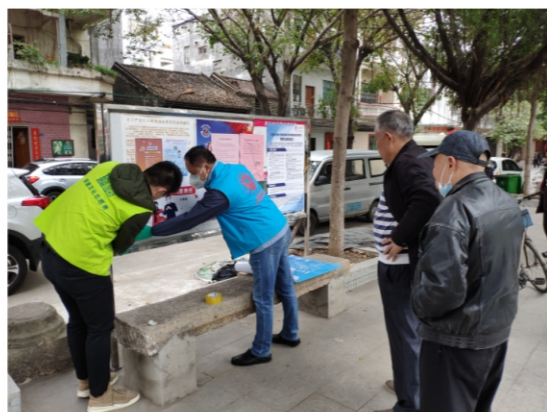
◆ 文艺中心党支部党员志愿服务队对杏坛镇疫情防控社会宣传查缺补漏