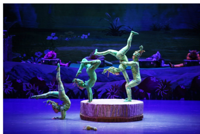
◆ 2020年顺德大剧院精品艺术季:杂技儿童剧《森林奇境》 时间:2020年12月5日 地点:顺德演艺中心大剧院