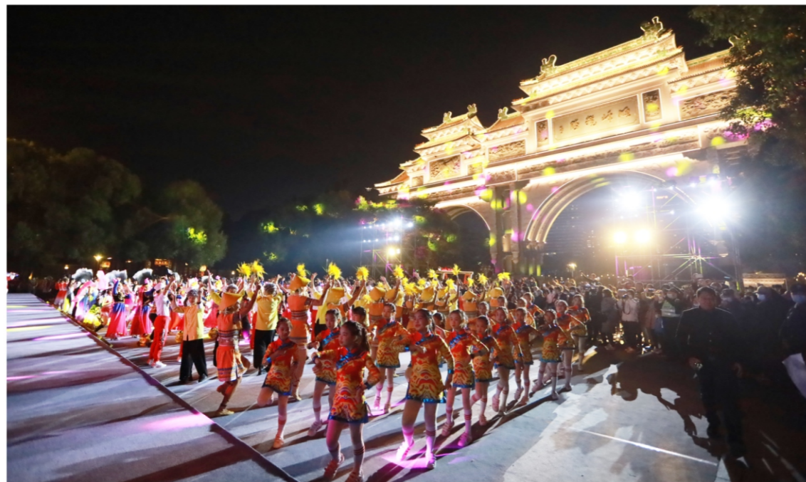
◆ “舞动新时代”2020顺德区广场舞展演活动 时间：2020年12月20日 地点：顺峰山公园