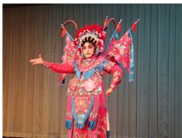
◆ “宝贝闪亮”2020少儿网络才艺展演决赛 时间:2020年12月5日 地点:顺德演艺中心音乐厅