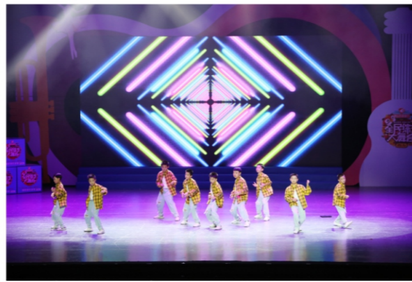
◆ 佛山韵律·幸福小康——佛山全民综艺大舞台暨“舞动全城”第四届广场舞展演顺德赛区决赛 时间:2020年9月20日 地点:顺德演艺中心大剧院