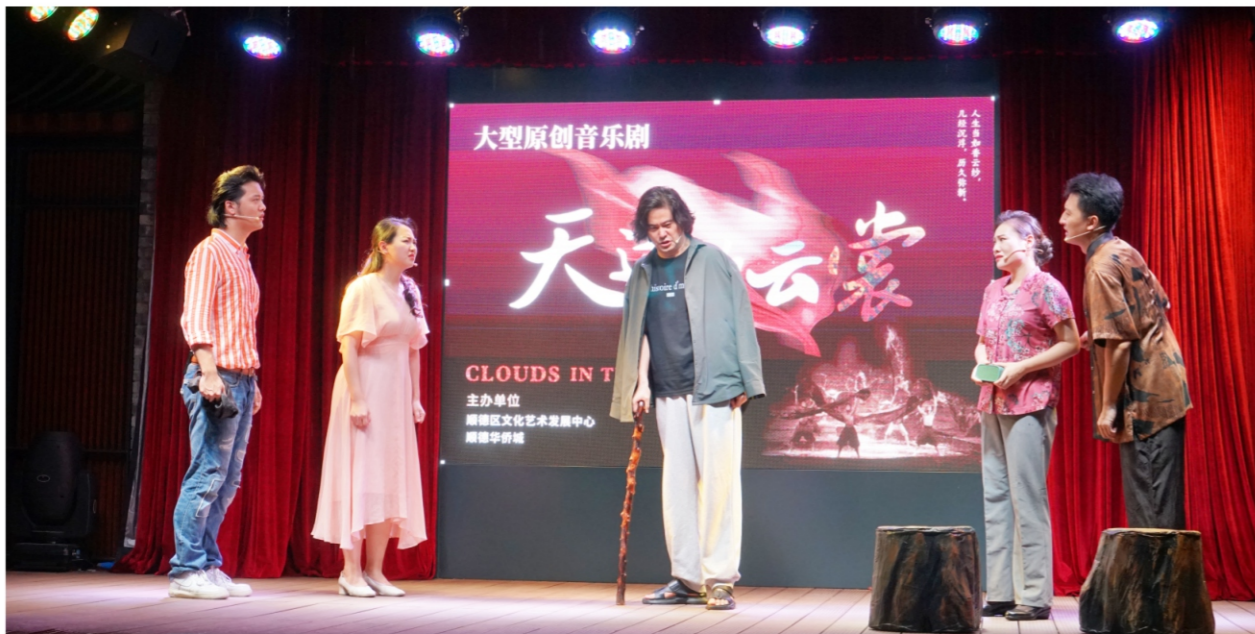
◆ 原创音乐剧《天边的云裳》巡演 时间:2020年9月9日 地点:顺德华侨城plus