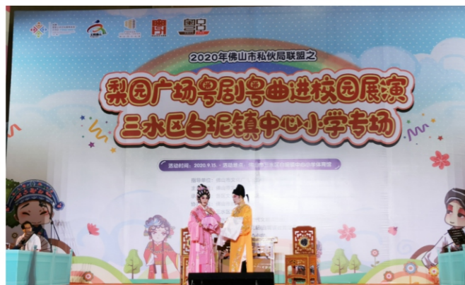
◆ 2020年佛山市私伙局联盟之梨园广场粤剧粤曲进校园展演 三水区白坭镇中心小学专场 时间:2020年9月15日 地点:三水区白坭镇中心小学