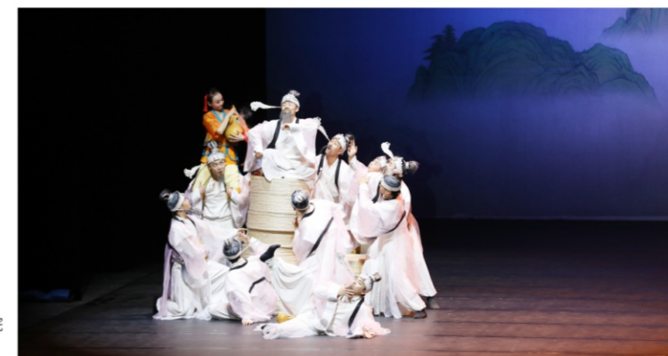
◆ 2020“顺德之夜”文化艺术盛宴： 四川省歌舞剧院——诗乐舞《大国芬芳》 时间：2020年12月29日 地点：顺德演艺中心大剧院