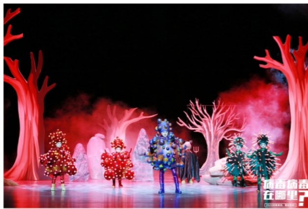
◆ 儿童剧《病毒病毒在哪里?》 时间:2020年10月16-18日 地点:顺德演艺中心大剧院