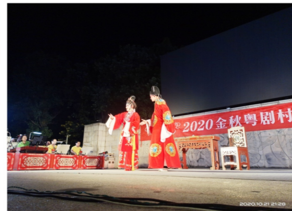
◆ 2020“农商银行之夜”金秋粤剧村(居)巡演活动: 佛山市一团粤剧有限公司折子戏专场 时间:2020年10月21日 地点:北滘广教