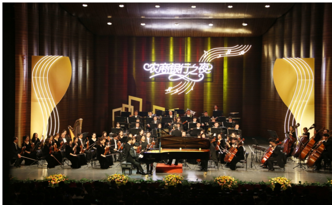
◆“农商银行之夜”2020顺德新年音乐会——上海歌剧院交响乐团 时间:2020年1月6-8日 地点:顺德演艺中心大剧院