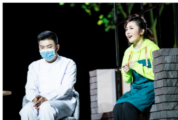
◆ 顺德原创抗疫题材话剧《爱的拿铁》巡演顺德医护专场 时间:2020年7月18日 地点:顺德演艺中心大剧院