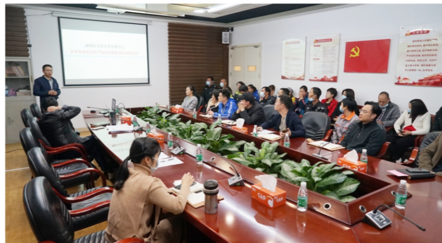
◆ 文艺中心岁末年初安全生产知识讲座 暨消防演练培训 时间：2020年12月25日 地点：顺德演艺中心