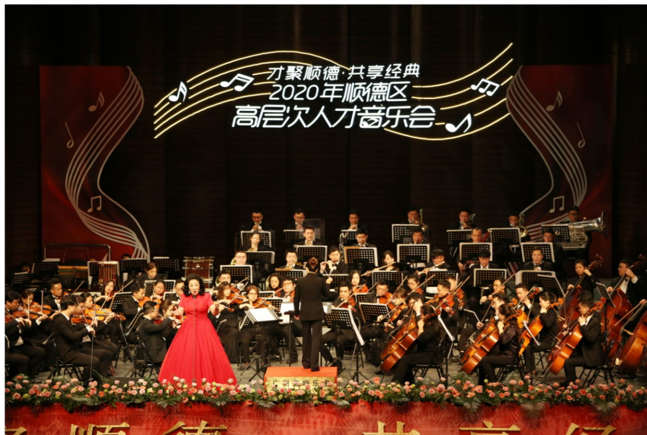
◆“才聚顺德·共享经典”2020年顺德区高层次人才音乐会 时间:2020年10月27-29日 地点:顺德演艺中心大剧院