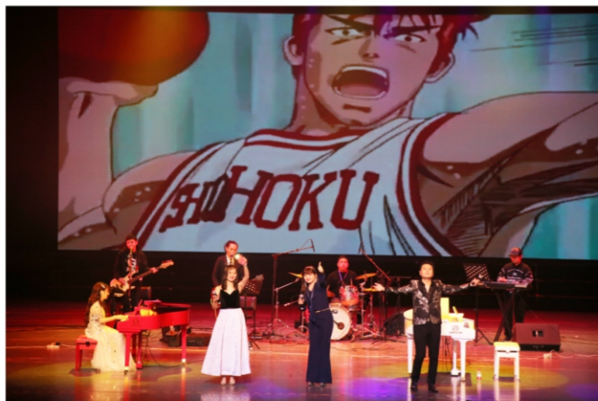
◆ 2020年顺德大剧院精品艺术季： “天空之城”——流行钢琴动漫作品专场音乐会 时间：2020年12月15日 地点：顺德演艺中心大剧院